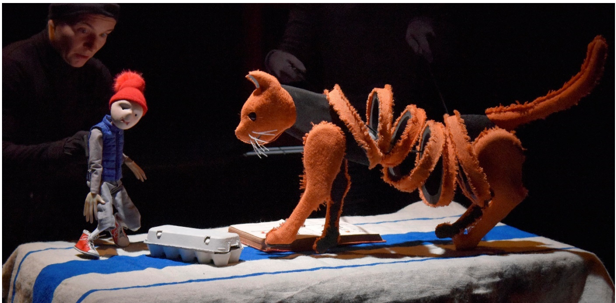
© Philippe Pache – Nils, le merveilleux voyage

Für Deutschsprachige geeignete Veranstaltungen